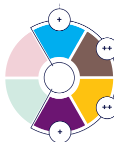
Fonctions dominantes des têtes de réseau régionales