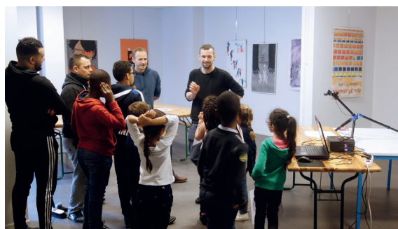
Des images à tous les âges.

En matière de communication, les programmations des adhérents sont valorisées dans une démarche globale de communication. Un programme papier est édité tous les 2 mois à 5 000 exemplaires. Sont également gérées par l'Univers, les relations presse tout comme la communication auprès des différents partenaires institutionnels et associatifs.