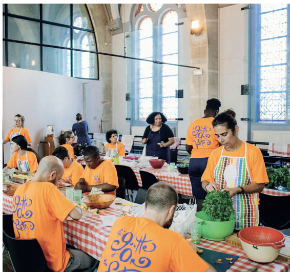
La Goutte d'Or en Fête.