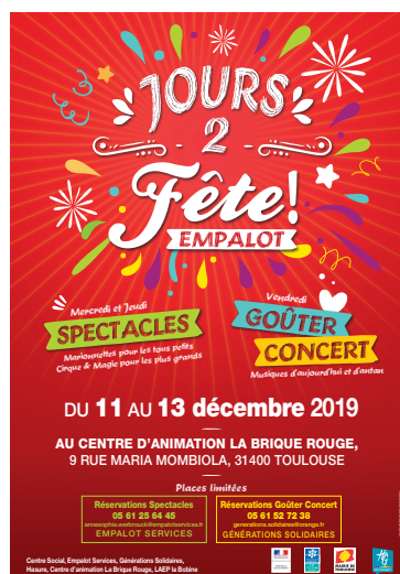
Jours 2 fêtes.