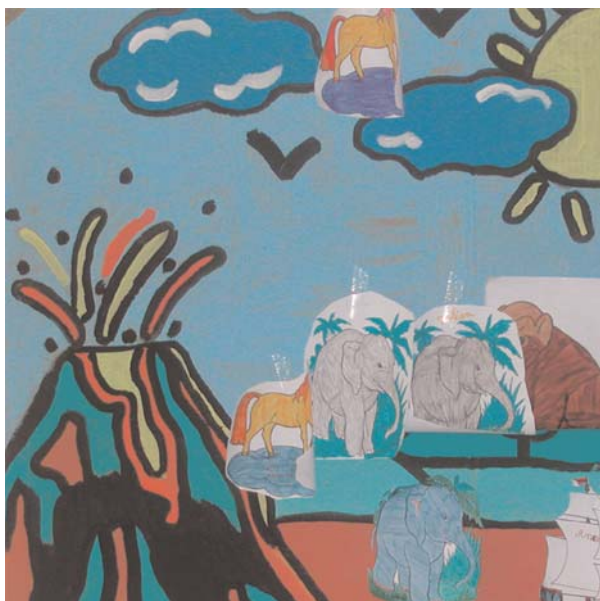
Dessin réalisé par des enfants participant aux activités du centre socio-culturel Val' Rhonne

La Conférence Permanente des Coordinations Associatives a engagé cette année deux actions de fond pour la défense et la promotion de la vie associative.